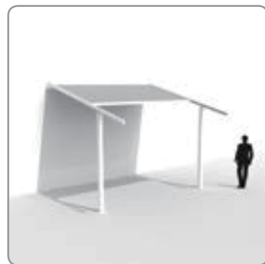
2. 移位立柱（顶面沿露台向外延伸）