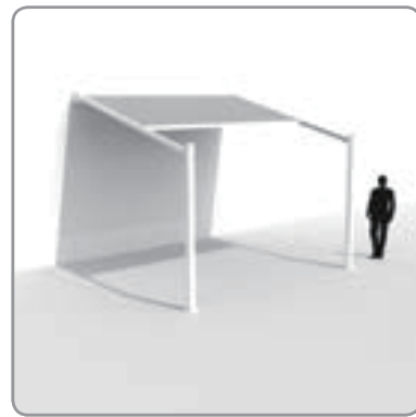
1. 端部立柱（全套排水系统）